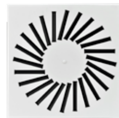
BQE PFAN60 € 74,00