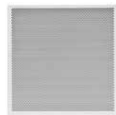
BQF PFAN60 € 78,00

Altri diffusori a richiesta Other air diffusers on request