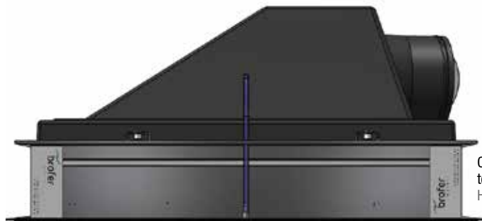
Cassonetto terminale HEPA HEPA Plenum box